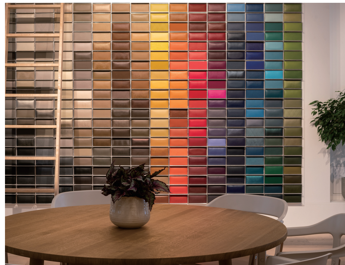
1.トレンドを踏まえて創造されるデザインコンセプト 2.着色剤の組み合わせで生まれる様々な色