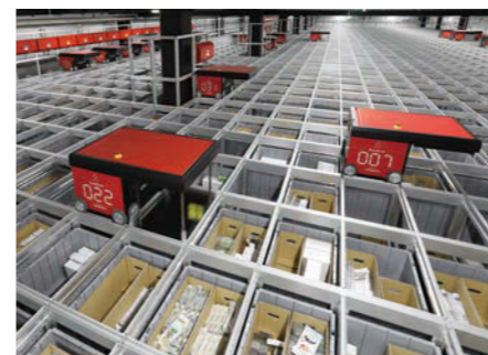
架台上: 広く浅く設計した保管エリアでは、国内最大規模の76台のロボットがポートまでスムーズに走行。