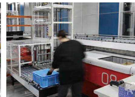
出庫ポート横のリフター・コンベヤで梱包エリアへ。作業者は定点で作業可能。