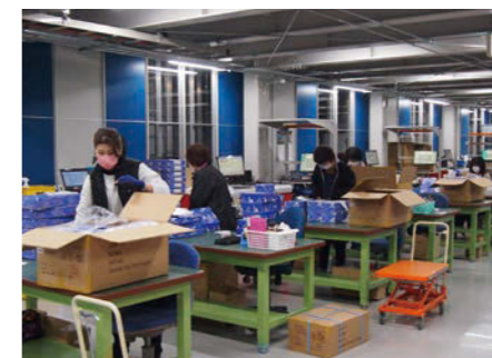
架台下: 入庫ポートに隣接して検品エリアを設置。